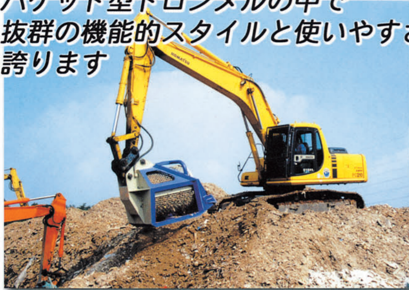
各種の油圧ショベルに

国内外、数社から提供されている バケット型トロンメルの中で 抜群の機能的スタイルと使いやすさを 誇ります