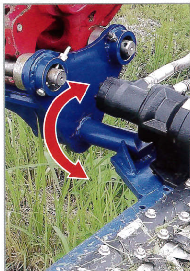
■ 角度調整ブラケット (45度ずつ調整)