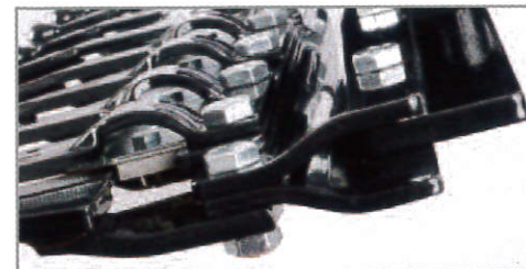
■ 刃物の脱着が容易 (ボルト固定)