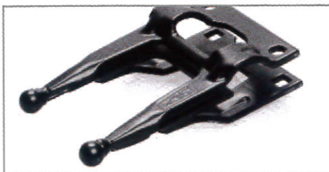
■ 丸いガード (小枝と葉の蓄積を防止できる)