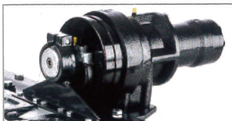
■ 減速機装着で力強く切断 (TTシリーズ)