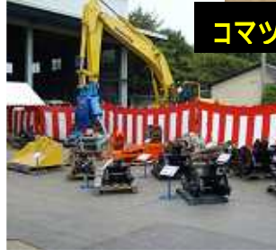
コマツ滋賀(株)八日市支店様