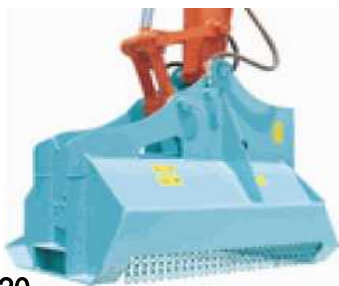
KS - 120