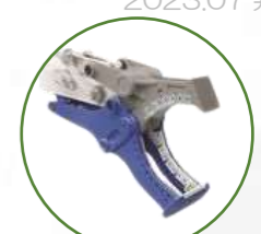
ミラクルカッター (片刃)