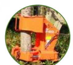
フェラーバンチャー