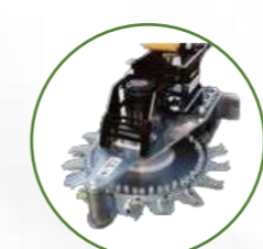
草刈剪定機(イワレ)